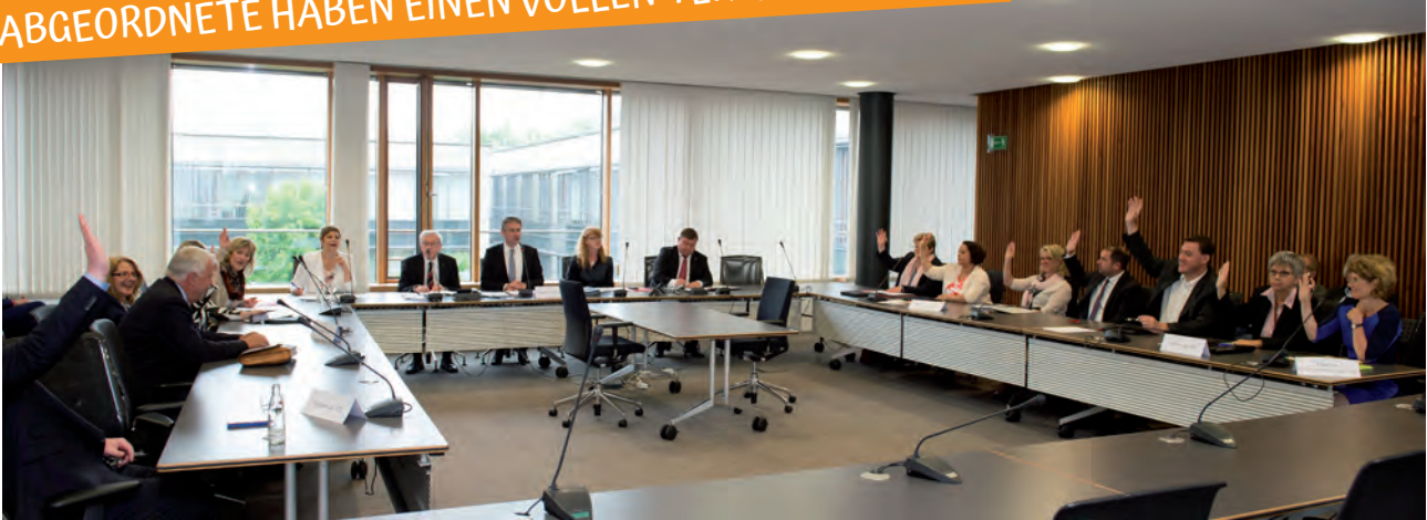
Abgeordnete bei einer Ausschusssitzung.

ABGEORDNETE HABEN EINEN VOLLEN TERMINKALENDER