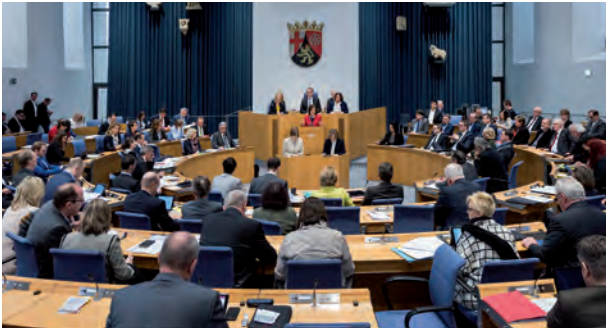
Abgeordnete debattieren während einer Plenarsitzung.

Landtagsabgeordnete haben sehr viele verschiedene Aufgaben. Besonders wichtig ist die Teilnahme an den Plenarsitzungen des Landtags. Ihr habt ja schon gehört: An zwei bis drei Tagen im Monat kommen die Abgeordneten in Mainz zu den Plenarsitzungen zusammen, um über wichtige Themen zu diskutieren und zu entscheiden. Neben den Plenarsitzungen gibt es viele andere Treffen, an denen die Abgeordneten teilnehmen, um sich auf die Plenarsitzungen vorzubereiten und um zu diskutieren.