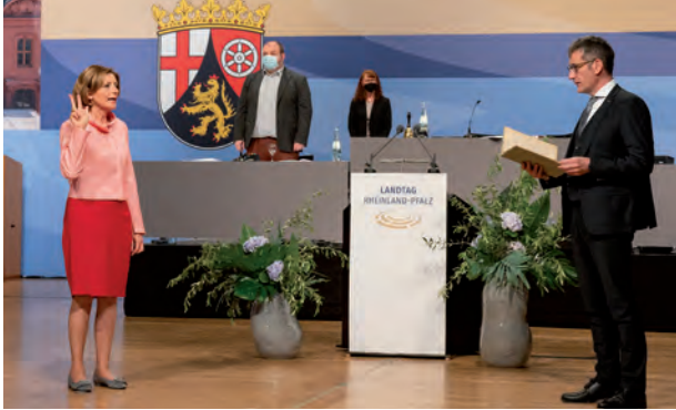
Amtseinführung der Ministerpräsidentin.

Am 18. Mai 2021 sind die Abgeordneten das erste Mal für eine Plenarsitzung zusammenkommen. Alle Abgeordneten haben einen festen Sitzplatz. Alle Abgeordneten, die zur selben politischen Partei gehören, sitzen zusammen und bilden eine Fraktion. Nach der ersten Plenarsitzung treffen sich alle Abgeordneten einmal im Monat, um an zwei bis drei Tagen über wichtige Themen zu diskutieren und abzustimmen.