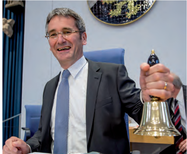
Der Landtagspräsident leitet die Plenarsitzung.

Ganz vorne sitzt der Landtagspräsident. Er ist dafür zuständig, dass die Plenarsitzungen des Landtags reibungslos ablaufen. Seine Aufgabe ist es, die Sitzungen zu leiten. Der Landtagspräsident achtet beispielsweise darauf, dass die Abgeordneten nicht zu lange reden und er vermittelt bei Streitigkeiten. Wer im Landtag sprechen möchte, benötigt übrigens die Erlaubnis des Landtagspräsidenten. Er ist so etwas Ähnliches, wie der Schiedsrichter beim Sport.