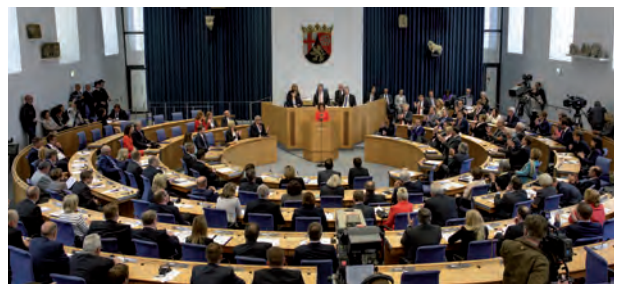
Abgeordnete debattieren während einer Plenarsitzung.

Zwei- bis dreimal im Monat treffen sich alle 101 Abgeordneten im großen Plenarsaal. Dort diskutieren und entscheiden sie über verschiedene Themen, die wichtig sind für Rheinland-Pfalz. Beispielsweise diskutieren und entscheiden die Abgeordneten regelmäßig darüber, wie viele Schülerinnen und Schüler in einer Schulklasse sitzen sollten. Solche Sitzungen können sehr lange dauern – manchmal dauert eine Plenarsitzung mehr als 10 Stunden.